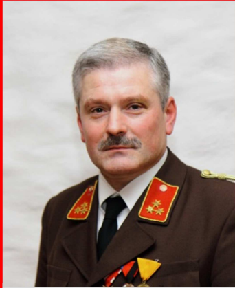
„Gott zur Ehr, dem Nächsten zur Wehr“